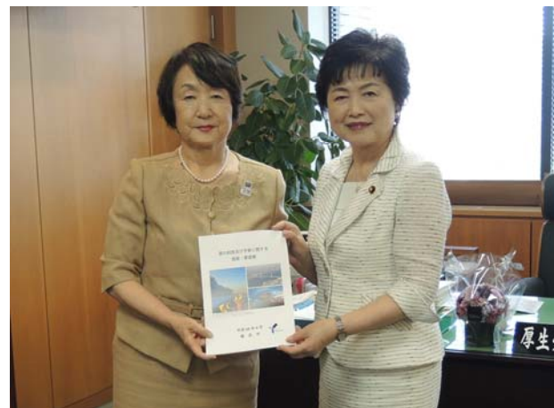
(高木 美智代 厚生労働副大臣)