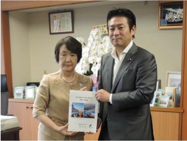
(あきもと 司 国土交通副大臣)